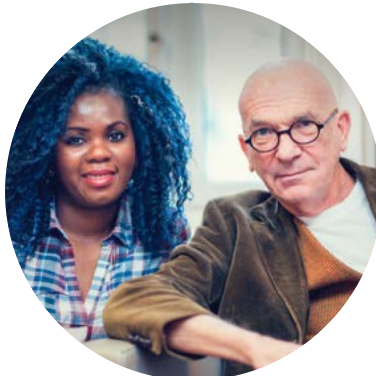
DUO FOR A JOB France & Belgique

CommonLit cherche à résoudre la disparité d'accès aux ressources éducatives de qualité et à faire en sorte qu'un plus grand nombre d'étudiants à faible revenu obtiennent leur diplôme d'études secondaires et acquièrent les compétences en lecture et en écriture dont ils ont besoin pour réussir. CommonLit a développé un programme innovant et gratuit d'apprentissage de la lecture qui aide les enseignants à faire progresser l'alphabétisation de leurs élèves.