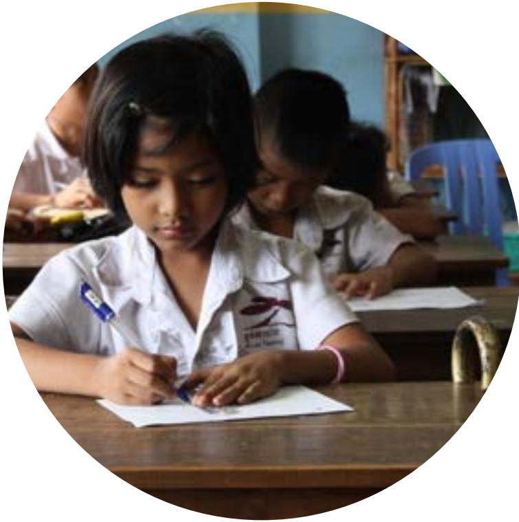
M'LOP TAPANG Cambodge