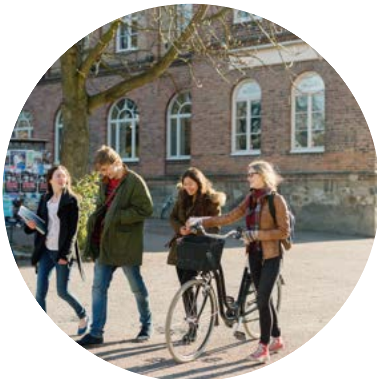
THE JED FOUNDATION Etats-Unis

Télémaque soutient des collégiens, des lycéens et des apprentis très motivés issus de milieux modestes afin de les encourager à réaliser leur plein potentiel grâce à une approche unique de double mentorat, en recevant le soutien à la fois d'enseignants et de mentors d'entreprise.