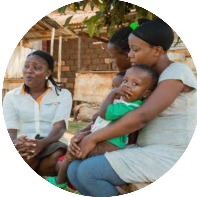
STRONGMINDS Uganda & Zambia

Street League utilise le sport pour mettre fin au chômage structurel des jeunes en leur enseignant des compétences professionnelles essentielles telles que le travail d'équipe, le leadership, la résolution de problèmes, et propose gratuitement un soutien éducatif et une formation professionnelle de premier rang aux jeunes sans emploi.