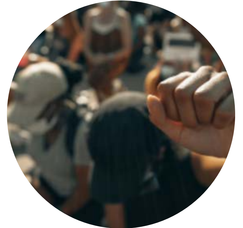
COMMON JUSTICE Etats-Unis

CFK Africa est une organisation locale, basée sur une approche dite communautaire et holistique, et dont la mission est de faire émerger des leaders locaux, de générer un changement positif et de réduire la pauvreté dans le bidonville de Kibera à Nairobi, au Kenya. Les programmes de CFK sont alignés sous trois départements : soins de santé primaires, éducation et moyens de subsistance et autonomisation des filles.