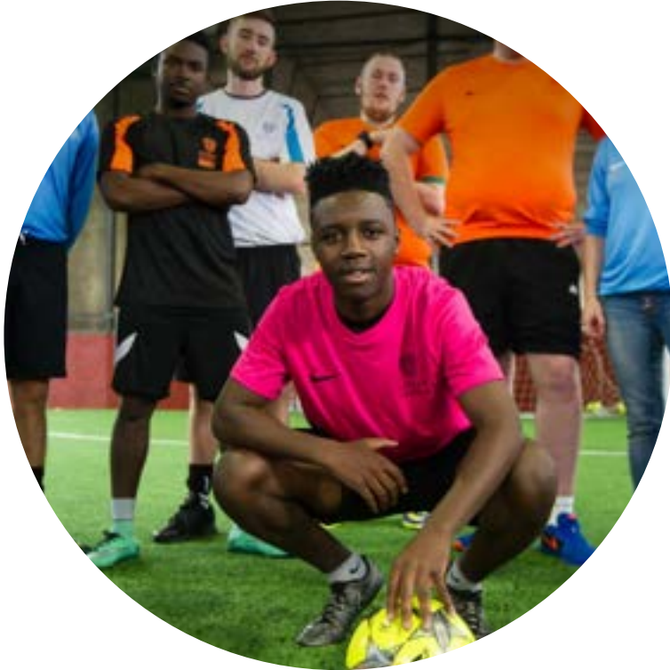
STREET LEAGUE Royaume-Uni