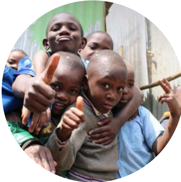
CFK AFRICA Kenya

L'objectif d' Apnalaya est de donner aux populations défavorisées vivant dans les bidonvilles de Mumbai les moyens de surmonter les nombreuses barrières sociales, politiques et économiques auxquelles elles sont confrontées, et de les aider à accéder aux opportunités qui mènent à une meilleure qualité de vie.